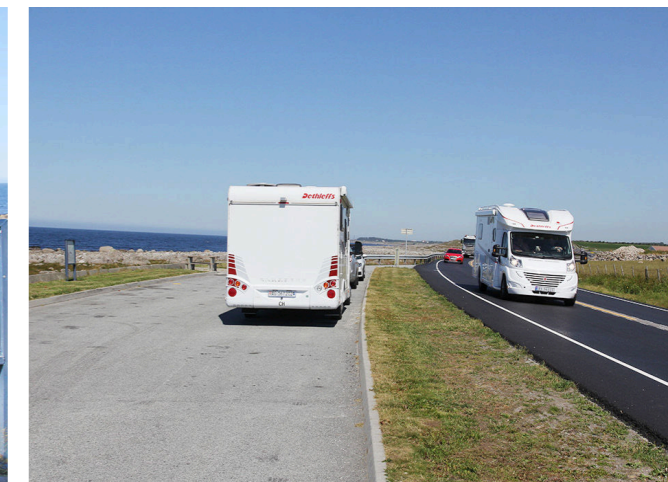
HÅRR: Dagens rasteplass på Hårr er lang og smal. I utgangspunktet har Fylkesmannen høy terskel for å gi tillatelse til utvidelse vestover mot verneområdet. Om rasteplassen skal bli større, må den med andre ord vokse i lengden.