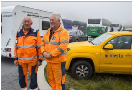
HINDRE KAOS: Dirigeringen av trafikken i Trollstigen i sommer skal forhindre at det blir kaos på den smale veggen

EVY KAVLI evy@andalsnes-avis.no telefon: 905 19 465