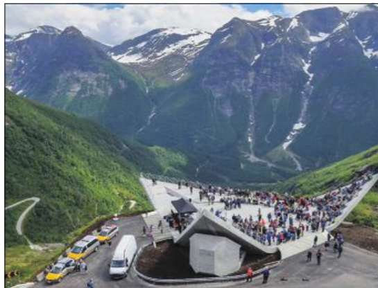
UTSIKTEN: I juni 2016 opna den «nye» Utsikten på Gaularfjellet.