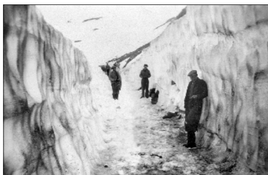
SNØ: Manuell snømaking på Gaularfjellsvegen våren 1949. Dei starta på toppen og grov seg nedover. Når dei kom så langt at dei ikkje klarde å hiva snøen over kanten, måtte dei få hjelp i frå ein ekstra mann. Då laga dei ei hylle i brøytekanten der han stod og tok i mot og kasta han vidare opp.