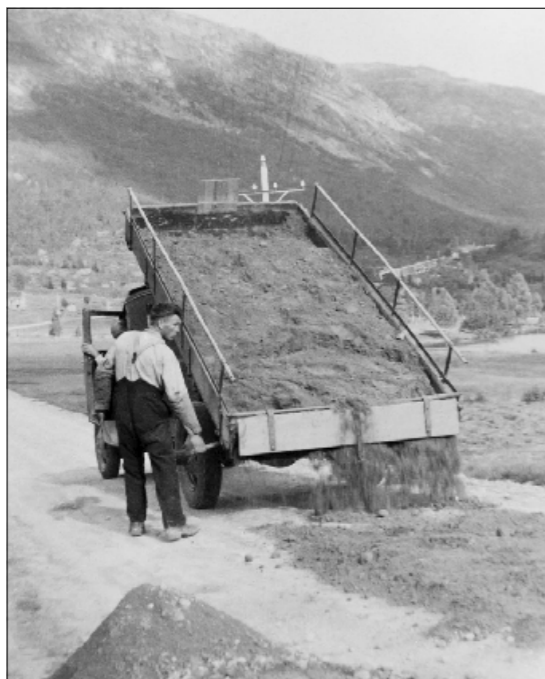
MJELL: Veggen over Gaularfjellet vart driven frå begge sider. Bildet er frå Mjell i Gaular og Martin Vallestad står bak og kontrollører når lastebilen tømmer gruslasset. Bildet skal vere frå 1939.