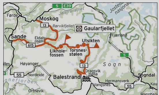
VIKTIG FJELLOVERGANG: Gaularfjellet gir kortare veg til Førde og Sande for særleg vtelefjordingar og sværefjordingar. Vegen har status som Nasjonal turistveg med fleire attraksjonar.