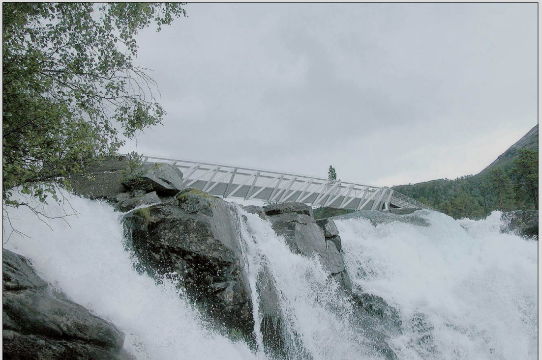
SPEKTAKULÆRT: Fossesenteret er planlagt like ved den dramatiske Likholefossen.