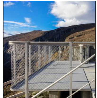
SIKRARE: Ny og sikker gangveg på kanten av juvet.

■ Gjesteteljar stoppa på 243.000 ved Fossli