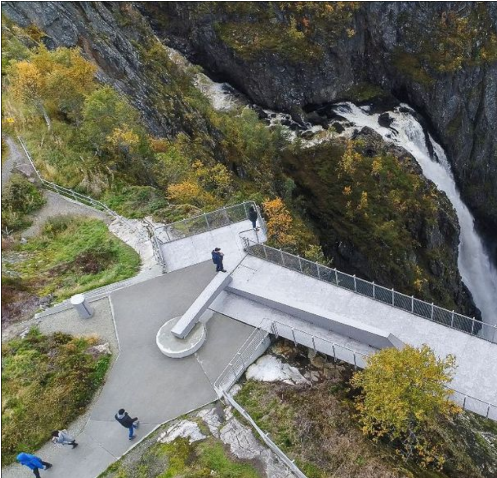
IKON: Vøringsfossen, eit reiselivsikon der Statens vegvesen satsar tungt.